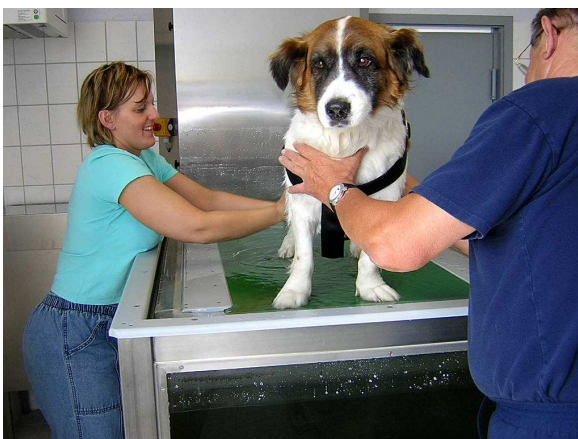
Puh, bin ich nass. Hier wird mir das Wasser aus dem Fell gedrückt