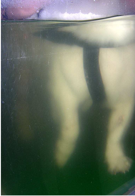
So sieht es von vorne aus

Jetzt bin ich genug gelaufen. Schade, denn es hat richtig Spaß gemacht