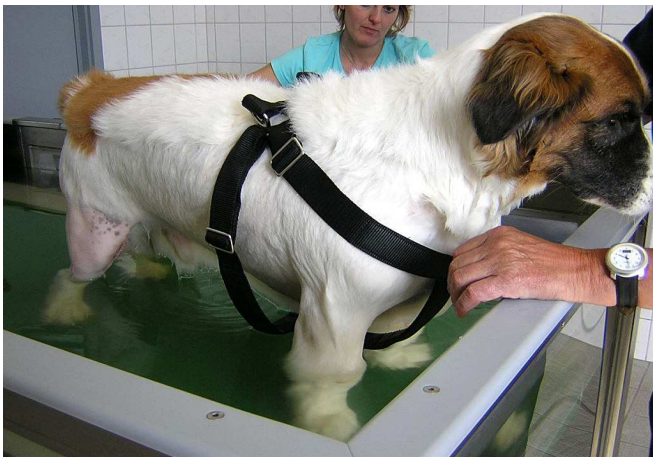
Gleich bin ich wieder oben. Du siehst genau wie tief ich im Wasser war.